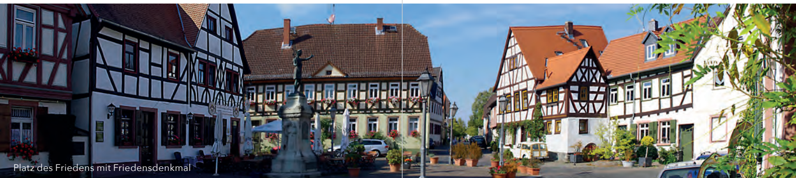
Platz des Friedens mit Friedensdenkmal